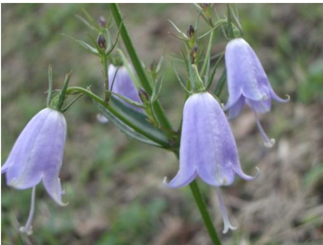
ツリガネニンジン