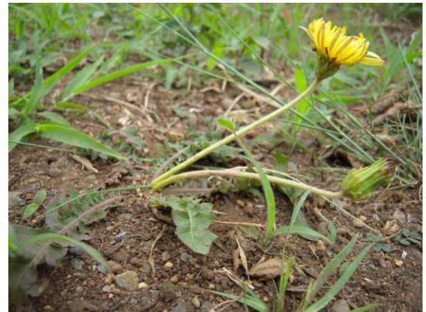
カントウタンポポ