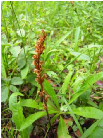
ヤセウツボ (外来の寄生植物)